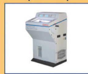
IHC & FROZEN