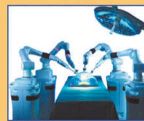
CMR ROBOTIC SYSTEM