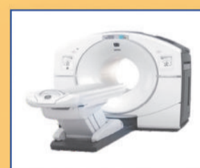
PHILIPS PET SCAN (64 SLICE)