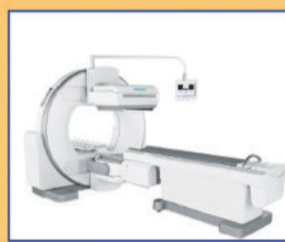
SPECT GAMA SCAN