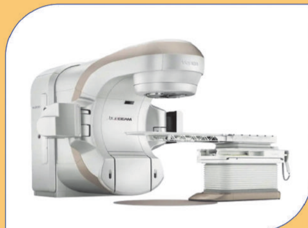
ADVANCED LINEAR ACCELERATOR (TRUE BEAM)

28 फरवरी 2026 शनिवार | समय : 11 : 30 बजे स्थान : श्री बालाजी हॉस्पिटल कैम्पस, मोवा, रायपुर