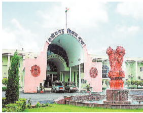
छत्तीसगढ़ विधानसभा का प्रश्नकाल