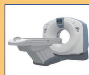
128 SLICE CT SCAN SIMULATOR