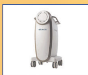
VARIAN BRACHY THERAPY